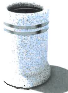
-orientacioni izgled parkovske klupe i korpe za otpatke